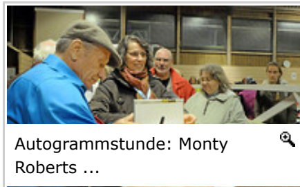
Autogrammstunde: Monty Roberts ...

Monty Roberts genoss sichtlich, dass er seine Arbeit vorstellen konnte. Der 79-Jährige präsentierte sich witzig und charmant, plauderte aus dem Nähkästchen und erzählte die ein und die andere Anekdote aus seinem Leben, immer mit einem Augenzwinkern und einem verschmitzten Lächeln. Der Amerikaner verstand es prächtig, die Besucher zum einen zu unterhalten, zum anderen aber auch für seine Art, mit Pferden zu arbeiten, zu sensibilisieren.